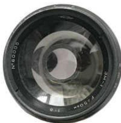
ЗМ-1 производства КМЗ: вид спереди

http://eugigufu.net/download/photovideo/