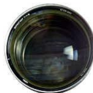
Вид на переднюю линзу