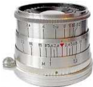
Индустар-26м производства КМЗ