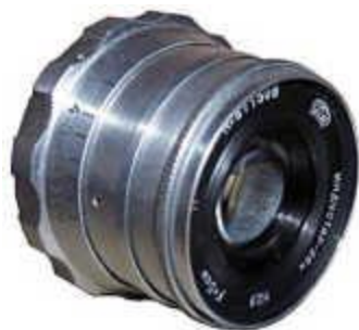
Индустар-26м производства ФЭД