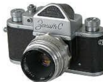
Индустар-26м производства КМЗ на зеркальной фотокамере