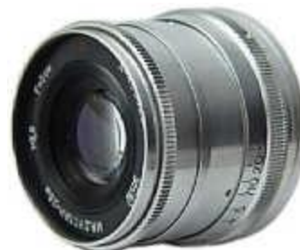
Индустар-26м производства ФЭД